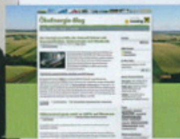
ÖKOENERGIE-BLOG.AT. Klima-Weblog der Raiffeisen-Leasing.