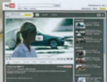
YOUTUBE.COM/BMW. Generiert 1,5 Mio. Video-Views pro Monat.