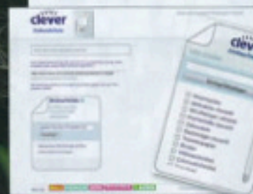
CLEVER-EINKAUFLISTE.AT. Via Handy wird der Einkauf verwaltet.

Doch Online-Werbung legt stetig zu. In den ersten neun Monaten dieses Jahres wuchs der Bruttoumsatz von Werbung im Internet im Vorjahresvergleich um 5,7 Prozent auf 33,6 Milliarden Euro. Noch werden die Umsätze hauptsächlich über Banner-Werbung erreicht. Doch bereits 2012, so Marktforscher Forrester Research, sollen über 40 Prozent aller Online-Spendings in die Vermarktung in sozialen Netzwerken wie Facebook und Co wandern.